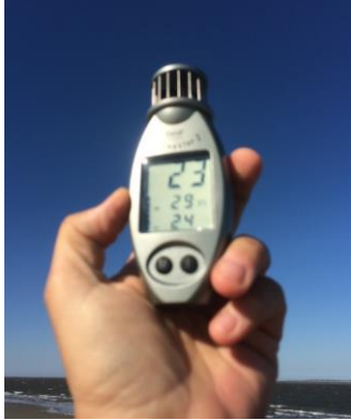
Wind Noord-Oost – avg 24knts g29knts!!

Met een goed gevulde maag de overtocht gemaakt naar Schier-West. Bleek inderdaad een pittige peddel etappe van bijna een uur... Wel een prettige bijkomstigheid dat bijna alle serieuze golven recht van voor kwamen en we het rustigere vaarwater tegemoet vaarden. Het pittig peddelen werd beloond, want we belanden in een „Oase van luwte“..